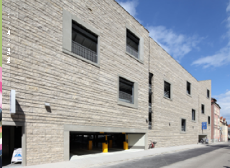
Geöffnet seit Ostern: Das neue Parkhaus St.-Peters-Weg.